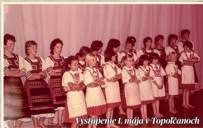
Vystúpenie 1. mája v Topolčanoch