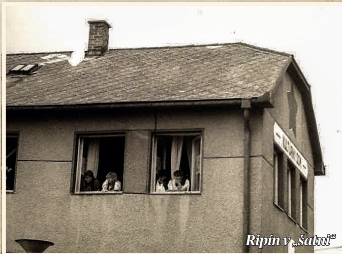
Ripín v „šatni“