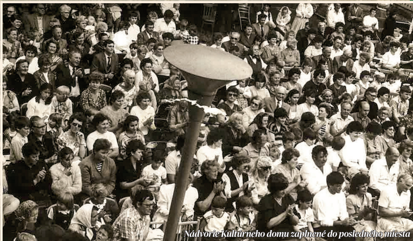
Nádvorie Kultúrneho domu zaplnené do posledného miesta