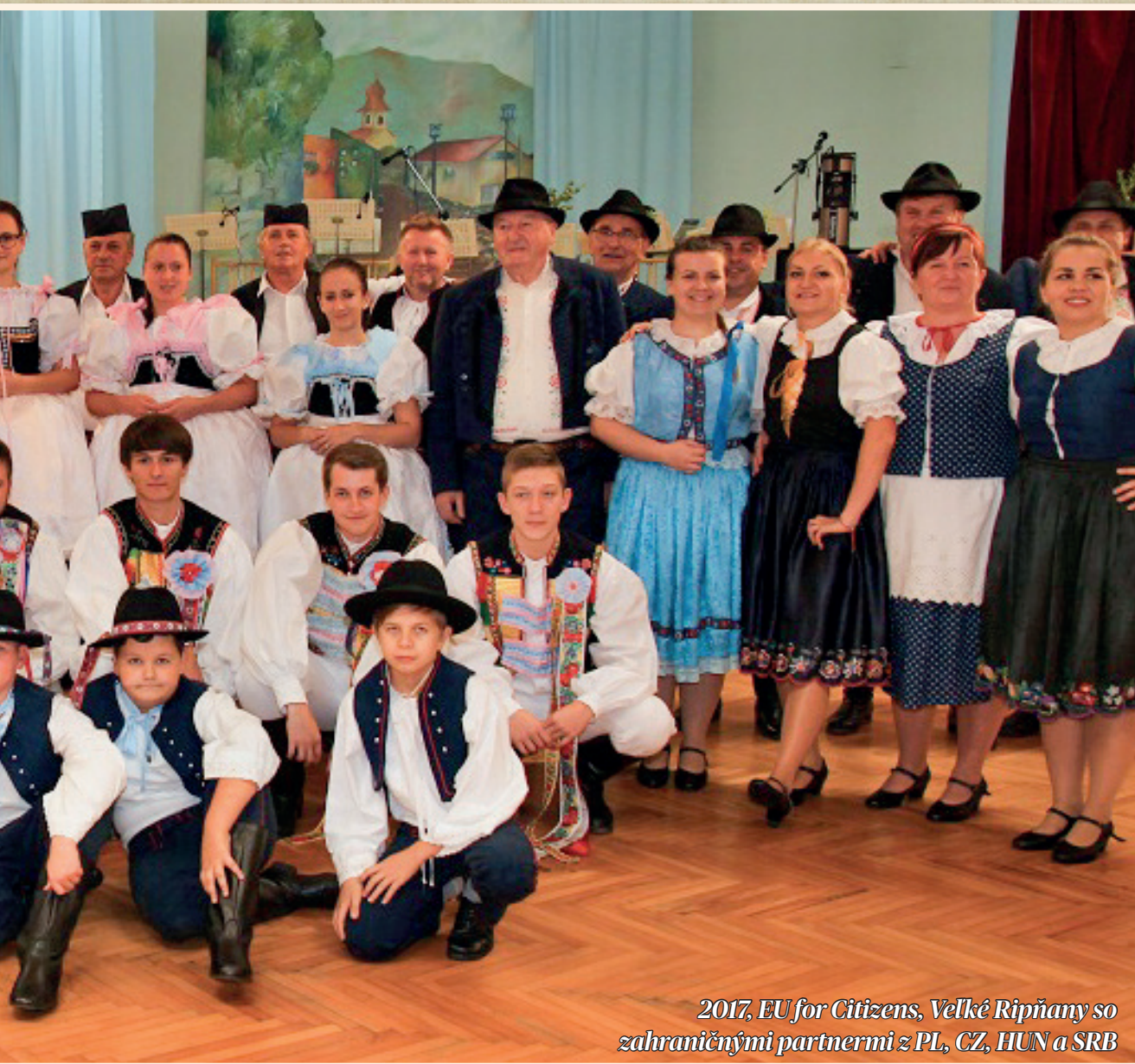
2017, EU for Citizens, Velké Ripňany so zahraničnými partnermi z PL, CZ, HUN a SRB