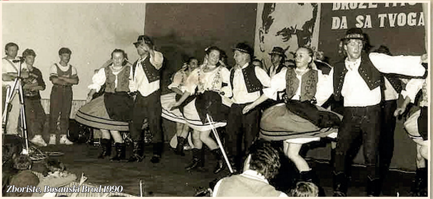
Zborište, Bosanski Brod 1990