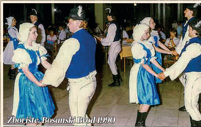
Zborište, Bosanski Brod 1990