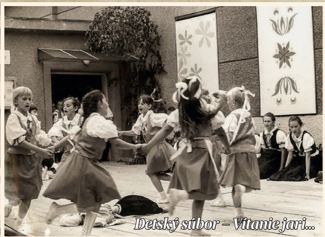
Deťský súbor - Vitanie jari...