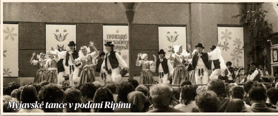
Myjavské tance v podaní Ripínu