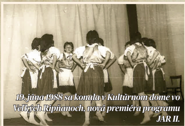
19. júna 1988 sa konala v Kultúrnom dome vo Veľkých Ripňanoch, nová premiéra programu JAR II.