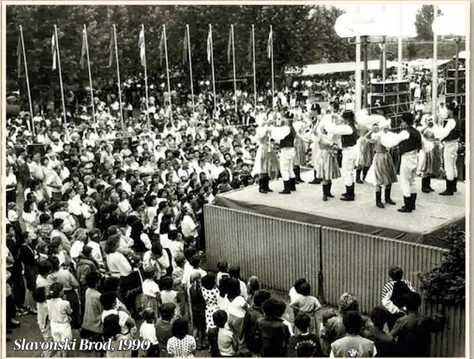
Slavonski Brod, 1990