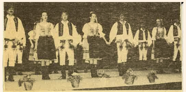
Účastníkov VČS JRD v. Ripňany potešil svojim vystúpením aj vlastný súbor.