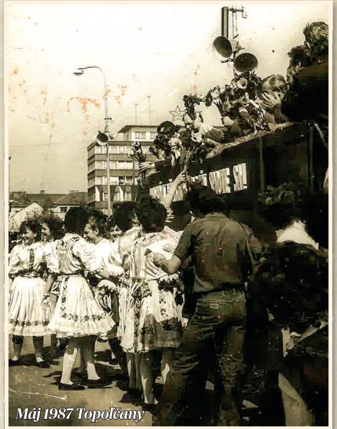
Máj 1987 Topolčany