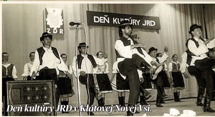
Deň kultúry JRD v Klátovej Novej Vsi.