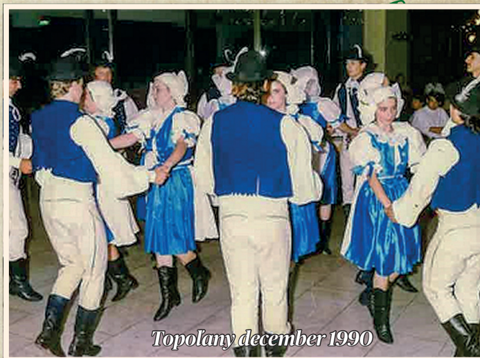
Topolany december 1990