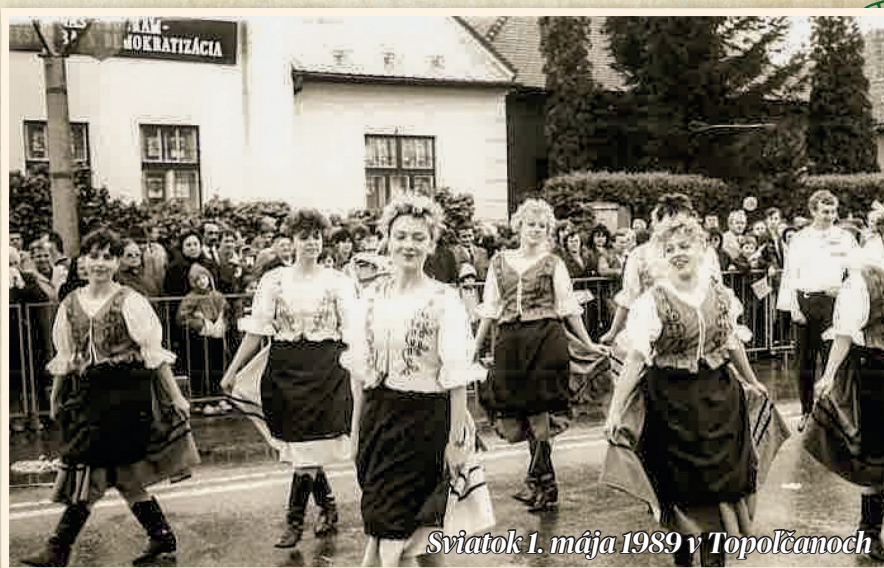
Sviatok 1. mája 1989 v Topolčianoch

4. júna 1989 sa v našej obci uskutočnili „Okresné folklórne slávnosti“, ktorých sa okrem Ripínu zúčastnili: Krnčianka z Krnče, Bukovina z Kšinnej, Lúčík, Priezor a Tatrovák z Bánoviec nad Bebravou, Perlička z Bojne, Jánošík a Jánošíček z Partizánskeho, Lúč z Bošian a Romo z Topolčian. Bolo treba upraviť starý kultúrny dom. Celý program bol na nádvorí kultúrneho domu. Celé