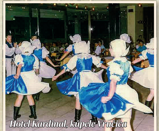
Hotel Kardinal, kúpele Vrućica