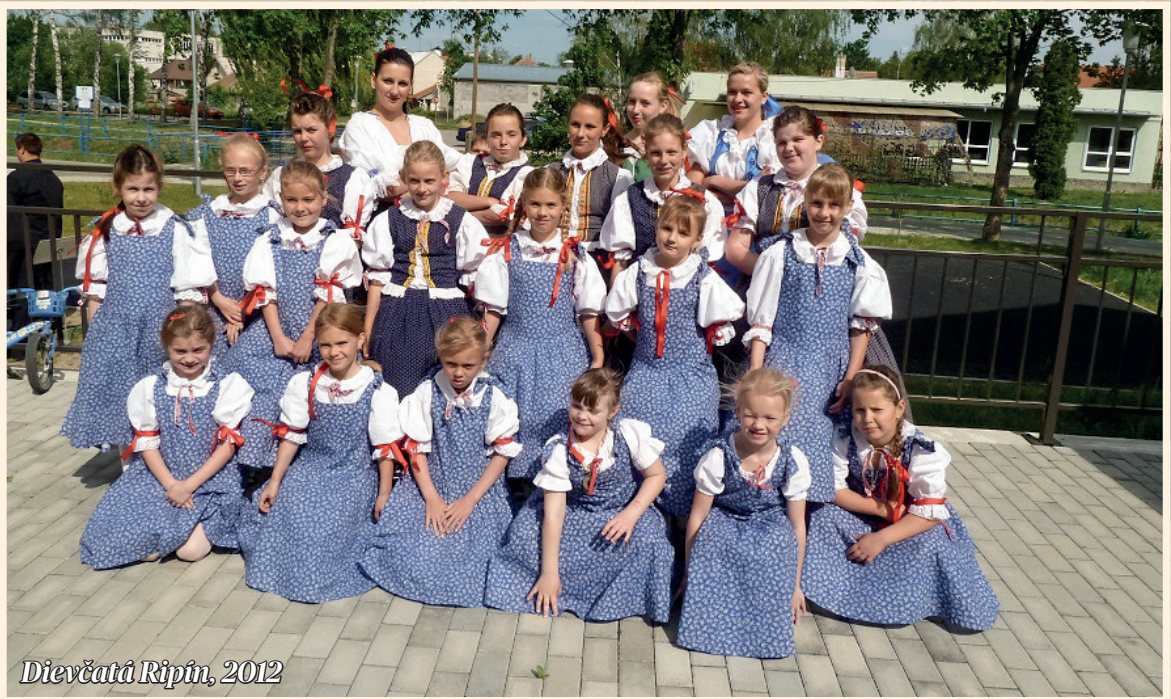
Dievčatá Ripín, 2012