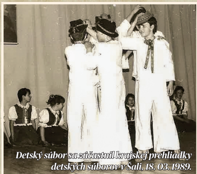
Detský súbor sa zúčastnil krajskej prehliadky detských súborov v Šali, 18. 03. 1989.