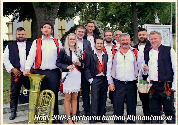
Hody 2018 s dychovou hudbou Ripňančankou