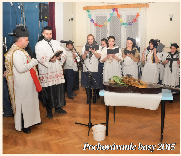
Pochovávanie basy 2015