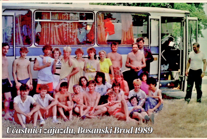
Účastníci zájazdu, Bosanski Brod 1989