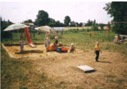
deti na školskom dvore