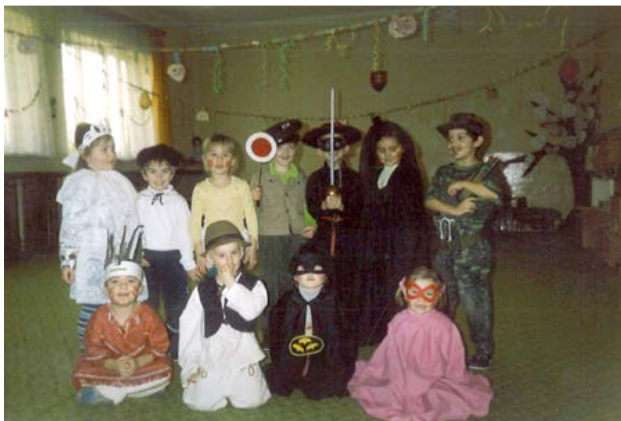
karneval v škôlke 2004