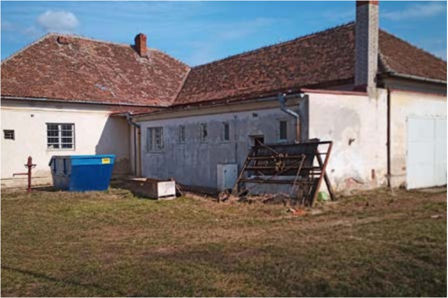
pred rekonštrukciou 2020