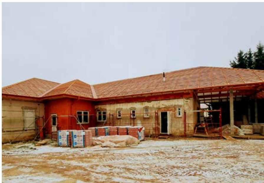
počas rekonštrukcie 2022