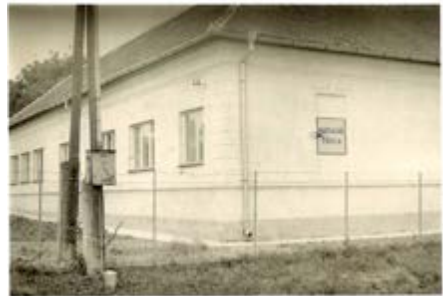
Materská škola 1978, pohľad od kostola