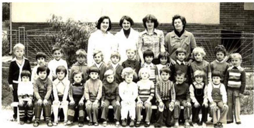
školský rok 1977/1978