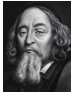
Ján Amos Komenský

Veľkým prínosom pre školstvo bolo pôsobenie učiteľa Jána Amosa Komenského, ktorý hoci nebol Slovak, vplýval aj na náš výchovný systém. Komenský zaviedol poriadok do školskej organizácie. Dieťa začína navštevovať materskú školu, po šiestom roku školu základnú, kde je vyučovacia reč materinská a trvá šesť